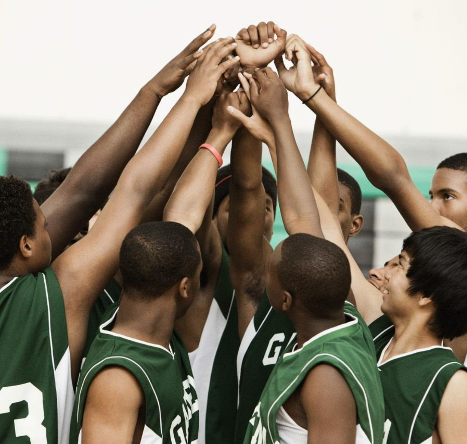
Bild mit Beschriftungs- layout